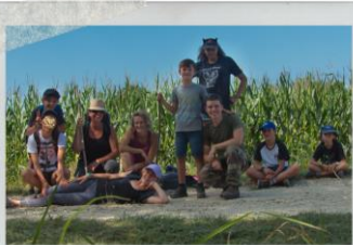
EN CAMP FIXE

Séjours de l'Été 2024 : vendredi 6 au samedi 12 Juillet, dimanche 14 au samedi 20 Juillet, lundi 22 au dimanche 28 Juillet, vendredi 3 au samedi 9 Août, dimanche 11 au samedi 17 Août, lundi 19 au dimanche 25 Août