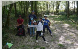
LE CLAN DES BOIS

Idées de projets : tout ce qui touche aux arbres (vergers et forêts), plantations et agroforesterie, construction et aménagement de cabane ou d'accrobranche, sculpture, apiculture, hôtel à insectes, chasse au trésor, etc