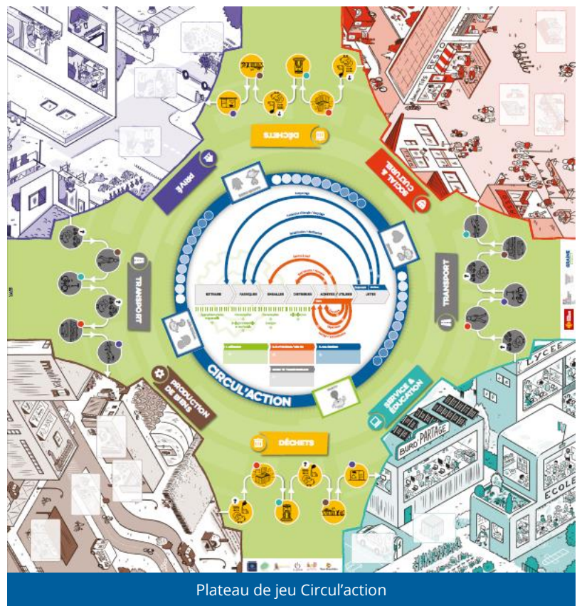
Plateau de jeu Circul'action

Il se joue à partir de 4 joueurs et jusqu'à 16 joueurs en physique autour du plateau. Il peut également se jouer avec davantage de joueurs (en classe par exemple) dans un format différent (avec projection du plateau au tableau par exemple). La durée d'une partie de jeu est comprise entre 1h30 et 2h15.