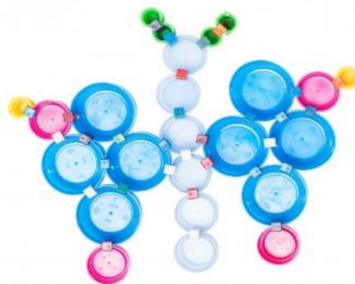
Clip it® Papillon

Le Clip It® est un jeu destiné majoritairement aux enfants et permet de créer des formes à partir de bouchons de bouteilles réutilisés et attachés entre eux par le biais de pinces en plastique recyclé. Ce jeu n'a pas été élaboré par le réseau GRAINE Occitanie mais est intégré également au kit pédagogique pour son aspect ludique et simple d'approche.