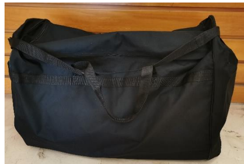
Sac de rangement

L'ensemble des outils du kit se rangent dans un grand sac de sport afin de faciliter le transport entre les différentes structures utilisatrices (cf §C). Les outils sont ensuite rangés de manière modulable afin qu'un animateur puisse emporter seulement l'outil dont il a besoin lors de son intervention et pas l'ensemble du kit pédagogique. Par exemple, les lests des pieds pour les kakémonos sont amovibles et leur poids est adaptable afin d'éviter le transport d'un poids important lorsqu'il n'y en a pas l'utilité.