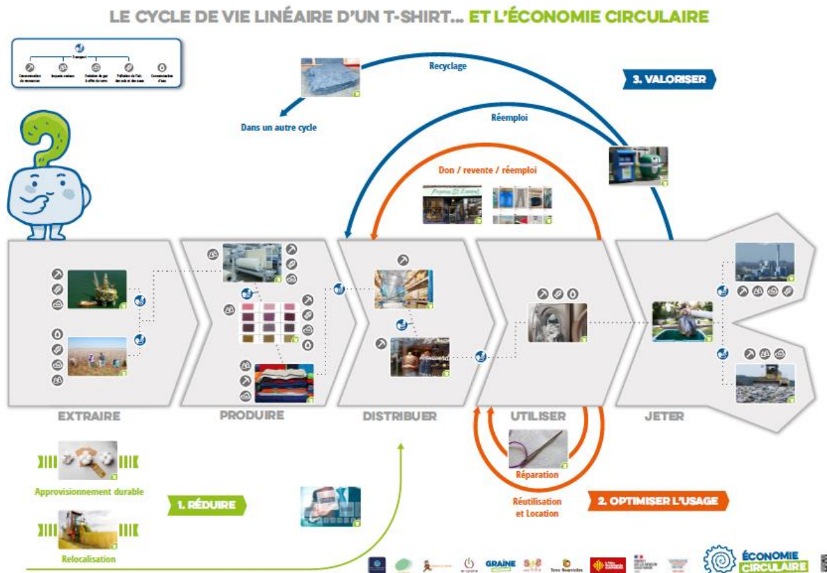
Exemple d'une bache de d'un cycle à l'autre

Cet outil, inspiré de la fresque du climat, permet d'aborder et/ou d'approfondir la notion de cycle de vie d'un produit.